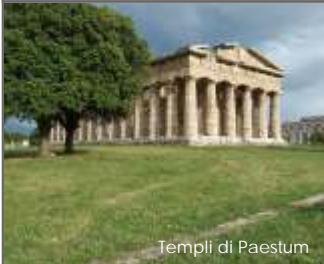
Templi di Paestum

Il camping lido Mediterraneo è situato a pochi chilometri da mete turistiche di grande interesse storico e paesaggistico.