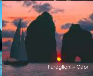
Faraglioni - Capri