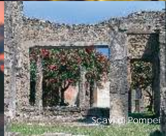
Scavi di Pompei