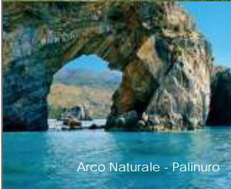
Arco Naturale - Palinuro